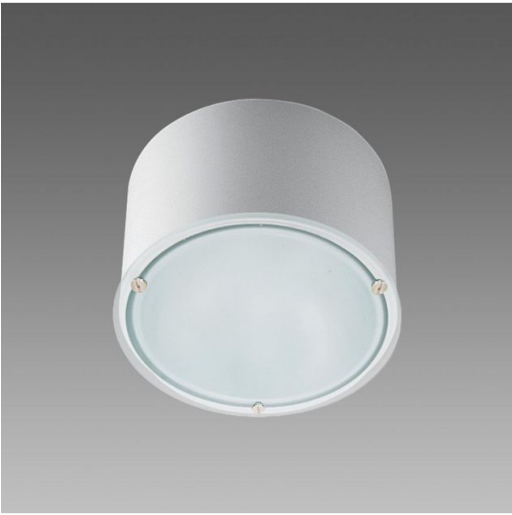
781 Compact - con SENSORE