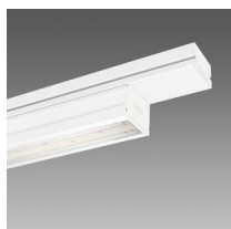
6613 Techno System HE - bi-asimétrico 25° - CRI 80