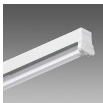
6402 Rapid system - monolámpara LED