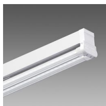
6502 Rapid system - bilámpara LED